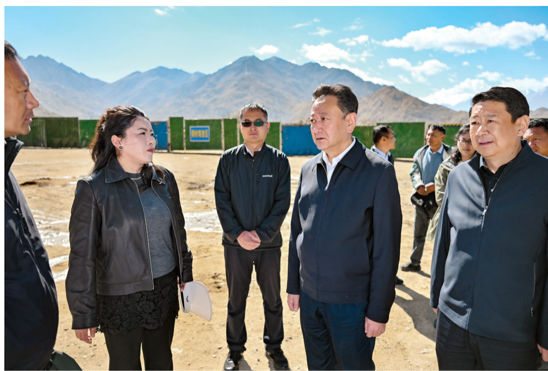
五月十六日，自治区党委常委、拉萨市委书记达娃次仁深入城关区，实地督导生态环境保护督察反馈问题整改落实情况。这是达娃次仁在尼次建筑施工队农民专业合作社了解扬尘治理等情况。