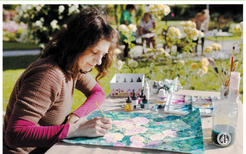
6月6日,斯洛文尼亚沃尔奇波托克植物园举行“玫瑰日”活动,展出上千个品种的玫瑰,吸引众多游客前来赏花。